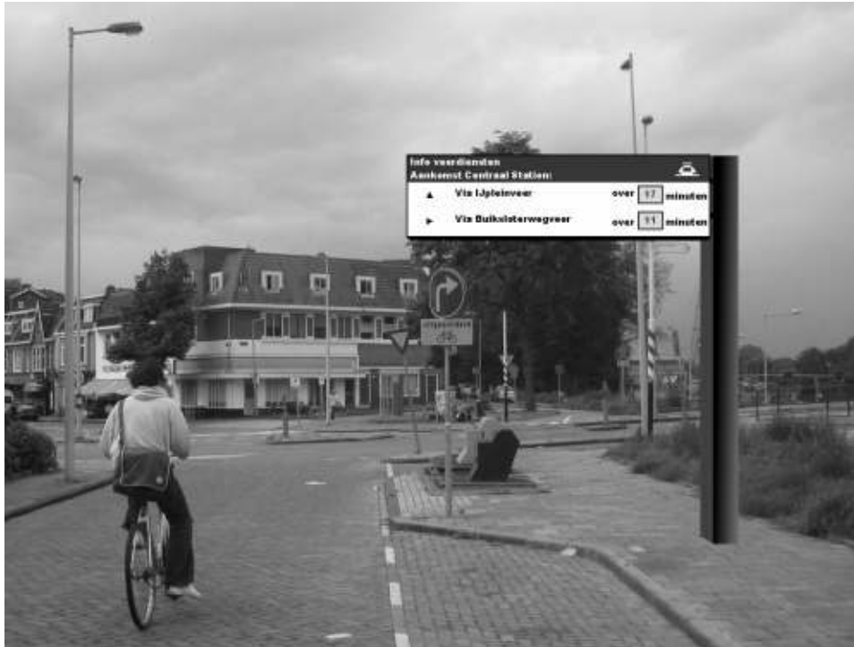
Figuur 1: Voorbeeld van een Fiets-DRIP met route-adviezen naar de eerste pont naar CS