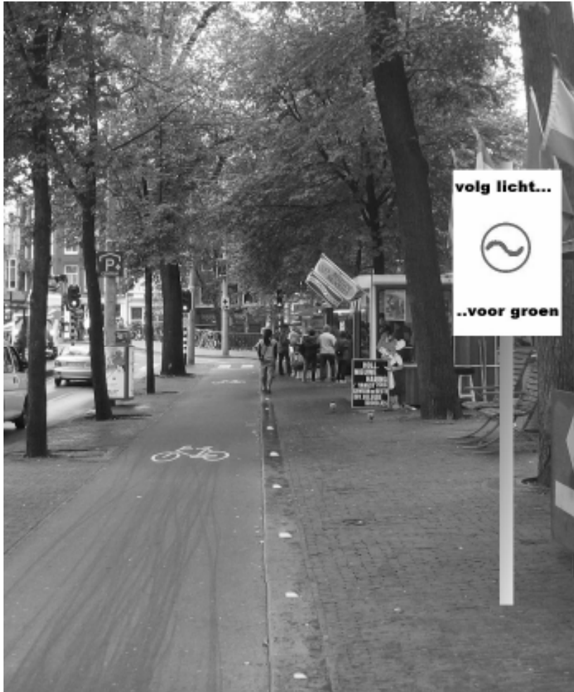
Figuur 2: Geleidelicht ter aanduiding van een groene golf (in dit geval via een rij al dan niet brandende groene lichtjes in de trottoirbanden)